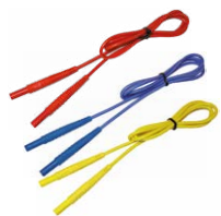
Prüfleitung 1,2 m 1 kV (Bananenstecker) rot / blau / gelb