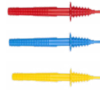
Prüfspitze 1 kV (Bananenbuchse) rot / blau / gelb