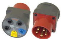
Adapter für Drehstrom-Steckdosen 16 A / 32 A