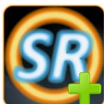
Software Sonel Reports PLUS