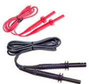
Prüfleitung 1,8 m 5 kV (Bananenstecker) rot / schwarz geschirmt